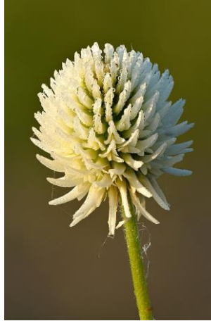
Hofpenklee und Bergklee